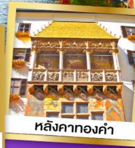
หลังคาทองคำ