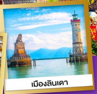
เมืองลินเดา