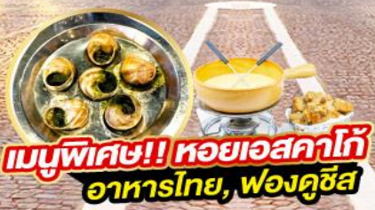
เมนูพิเศษ!! หอยเอสคาโก้ อาหารไทย, พองคูซัส