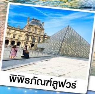
พิพิธภัณฑ์ลูฟวร์