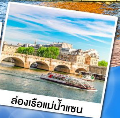
ล่องเรือแม่น้ำแซน

07-13, 21-27 ต.ค. 67 04-10, 18-24 พ.ย. 67 02-08 ธ.ค. 67