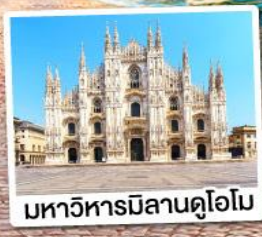
มหาวิหารมิลานดูโอโม