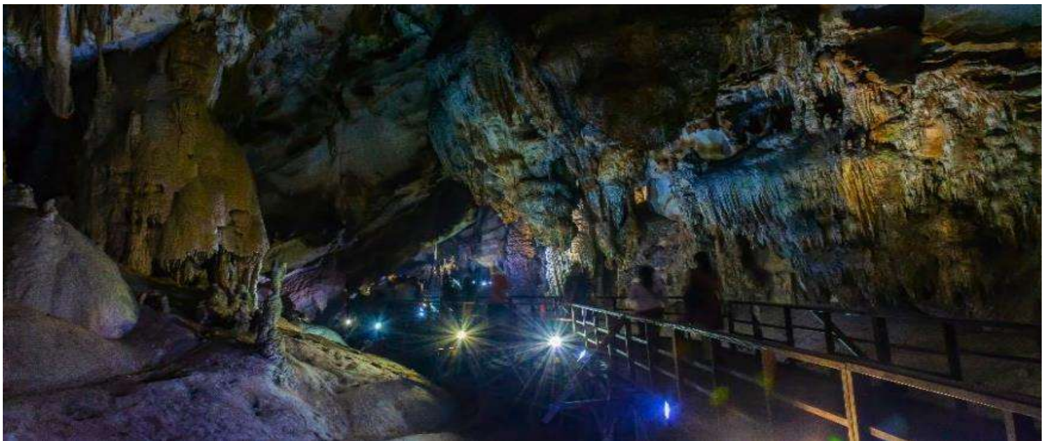
GO1HAN-VJ101 GO VIETNAM เวียดนามเหนือ ฮานอย ซาปา ฟานซีปัน ฮาลอง 5 วัน 4 คืน โดยสารการบิน Vietjet Air (VJ)

ระหว่างล่องเรือเที่ยวชม ถ้ำสวรรค์ หรือ “ถ้ำนางฟ้า” ชมหินงอกหินย้อยแห่งอ่าวฮาลองที่มีอายุนับล้านปี มีโครงสร้างสลับซับซ้อนกันหลายชั้นพร้อมประดับไฟไว้อย่างสวยงาม ภายในถ้ำจะเห็นได้ว่าหินงอกหินย้อยต่าง ๆ นั้นจะมีลักษณะรูปทรงแตกต่างกันออกไป ตามแต่ท่านจะจินตนาการ ขึ้นอยู่ว่าแต่ละท่านจะตีความออกมาว่าเป็นรูปทรงเหมือนสิ่งใดในถ้ำเราจะเห็นหินรูปนางฟ้าที่ถูกสร้างขึ้นมาจากทางธรรมชาติที่ติดอยู่ภายในผนังถ้ำ นับว่าเป็นสิ่งมหัศจรรย์อย่างหนึ่งและมีตำนานเล่าขานกันว่า มีเหล่านางฟ้าเข้ามาอาบน้ำในถ้ำแห่งนี้และเกิดหลงไหลชายหนุ่มผู้ที่เป็นมนุษย์เลยคิดที่จะไม่ยอมกลับสวรรค์ จนกระทั่งเวลาผ่านไปกลุ่มนางฟ้าทั้งหลายเลยกลายเป็นหินติดอยู่ที่ผนังถ้ำอย่างน่าอัศจรรย์.