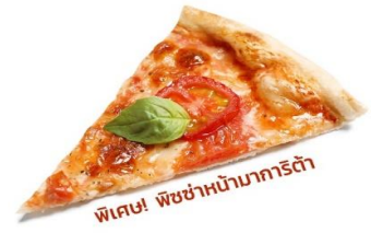
พิเศษ! พิซซ่าหน้ามากริต้า

(ชื่อโรงแรมที่ท่านพัก ทางบริษัทจะทำการแจ้งพร้อมใบนัดหมาย 5-7 วันก่อนวันเดินทาง)