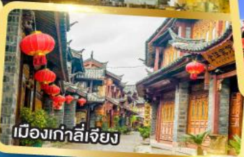
เมืองเก๋าลี่เจียง