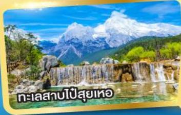
ทะเลสาบปี่สุยเหอ