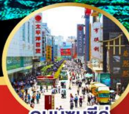
ถนนชุนซีลู่

ห้องพัก 4 ดาว ไม่เข้าร้านช้อปปิ้ง!! -เมนูพิเศษ สุกิหมาล่าสดฉวน , เปิดบักกิ้ง