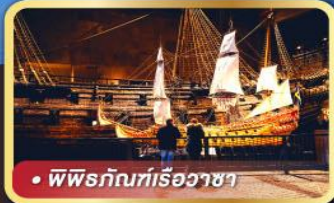
• พิพิธภัณฑที่เรือวาซา