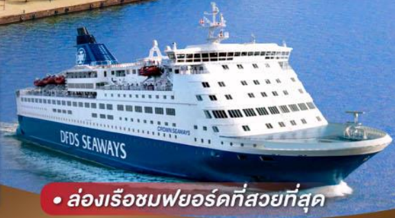
• ล่องเรือชมพยอร์ดที่สวยงามที่สุด