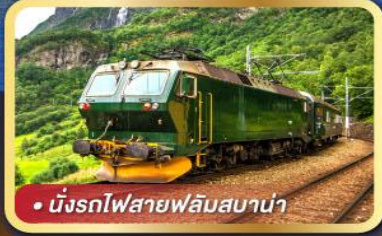
• นั้รงรถไฟสายฟลัมสบาน่า