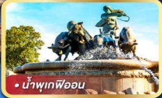
• น้ำพุเทพีออน