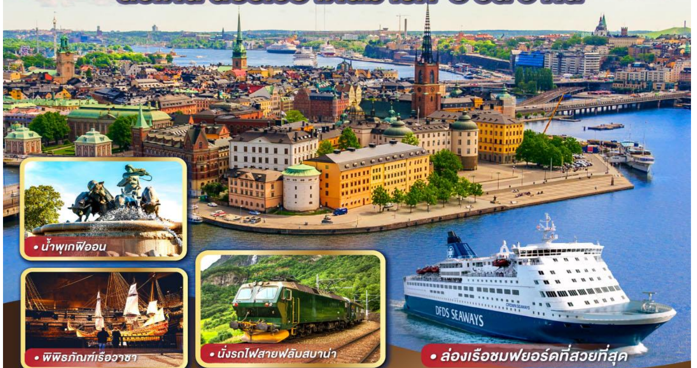
• น้ำพุเทพโอน