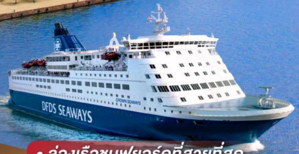
• ล่องเรือชมฟยอร์ดที่สวยงามที่สุด