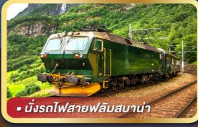
• นั้รงรถไฟสายฟลัมสบาน่า