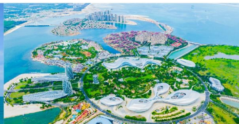
เกาะดอกไม้