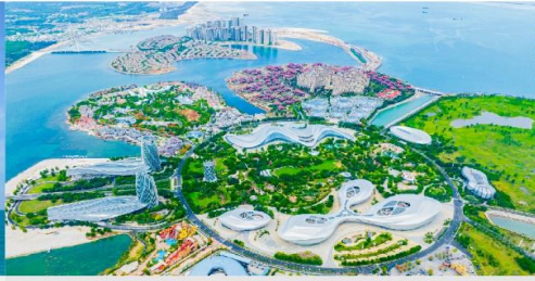
เกาะดอกไม้