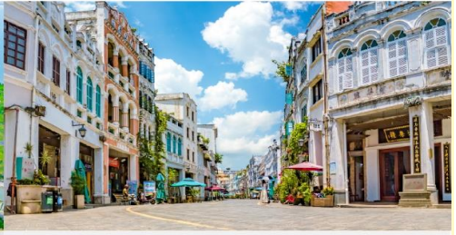
ถนนโบราณซีไห่ลว