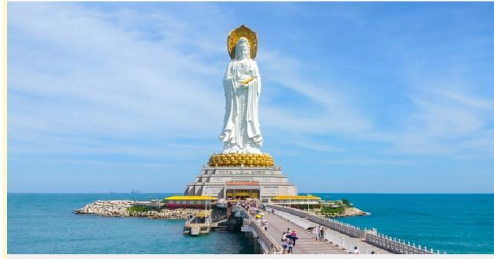
เจ้าแม่กวนอิมหนานซาน