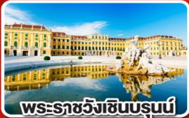
พระราชวังเซินบรุนน์