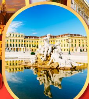
พระราชวังเซ็นบรุนน์