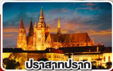
ปราสาทปราก