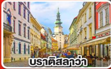
บราติสลาวา

เที่ยวเมือง คาร์โลวารี เมืองแห่งสปา พร้อมเมนูพิเศษเปิดโบฮีเมีย