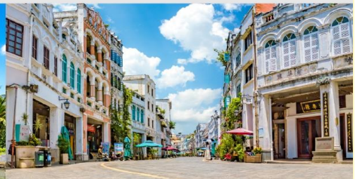
ถนนโบราณจีไหลว

*ทางบริษัทฯ ขอสงวนสิทธิ์ในการสลับโปรแกรมทัวร์ตามความเหมาะสมขึ้นอยู่กับสถานการณ์หน้างาน โดยคำนึงถึงผลประโยชน์ของลูกค้าเป็นสำคัญ