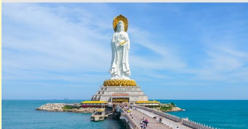
เจ้าแม่กวนอิมหนานซาน