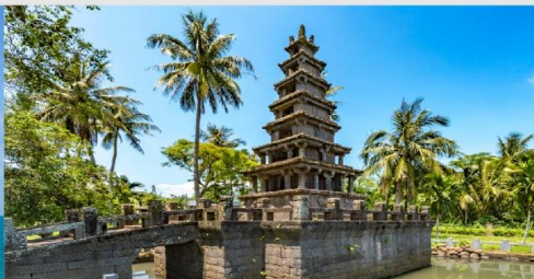
เจดีย์ 2 พี่น้องเหมยหลาง