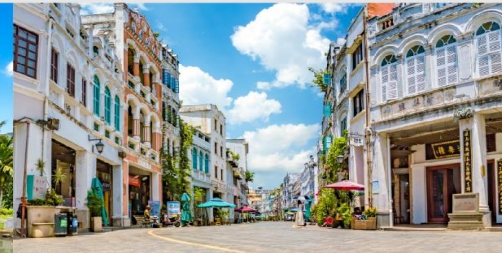
ถนนโบราณจีโหลว

*ทางบริษัทฯ ขอสงวนสิทธิ์ในการสลับโปรแกรมทัวร์ตามความเหมาะสมขึ้นอยู่กับสถานการณ์หน้างาน โดยคำนึงถึงผลประโยชน์ของลูกค้าเป็นสำคัญ