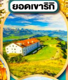
ยอดเขาริกิ