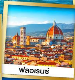
พลอเรนซ์