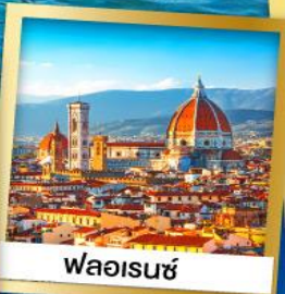
ฟลอเรนซ์