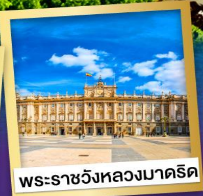
พระราชวังหลวงมาดริด