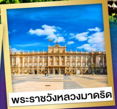
พระราชวังหลวงมาดริด