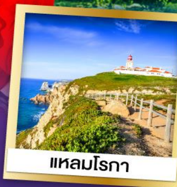
แหลมโรกา