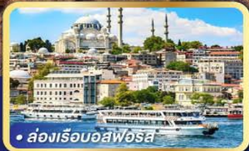
• ส่องเรืออิสฟอรุส