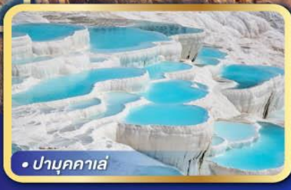
• ปามุกคาล่