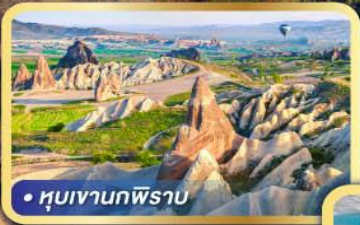
• หุบเขานกฟิราบ