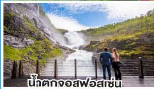
น้ำตกจอสฟอสเซ่น