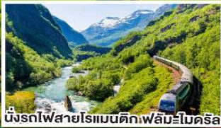
นั่งรถไฟสายโรเมนติกเฟลิมโบเดครัส