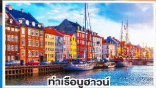
ท่าเรือบูฮาวน์