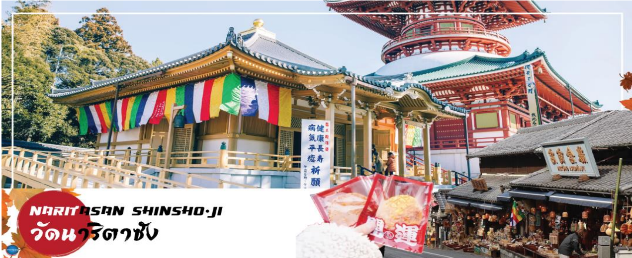
NARITASAN SHINSHO-JI วัดนาริตะชิน

วันที่สอง ท่าอากาศยานนานาชาตินาริตะ – เมืองนาริตะ – วัดนาริตะชิน – ถนนปลาไหล โอโมเตะซังโตะ – ย่านโอไดบะ – ห้างไดเวอร์ซิตี – เมืองนาริตะ