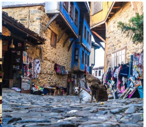
หน้า 15 (ภาพใช้เพื่อพิจารณาเท่านั้น)