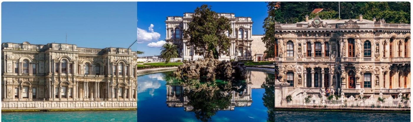
หน้า 14 (ภาพใช้เพื่อการโฆษณาเท่านั้น)

เช้า 📍 บริการอาหารเช้า ณ ห้องอาหารของโรงแรม จากนั้นนำท่านชม พระราชวังเบลเลอเบย์ (BEYLERBEYI PALACE) เป็นพระราชวังที่ตั้งอยู่ริมฝั่งทะเลของช่องแคบบอสฟอรัสในฝั่งเอเชีย ใกล้กับสะพานข้ามช่องแคบฯ แห่งแรก ถือเป็นพระราชวังฤดูร้อน