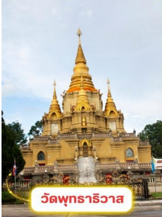
วัดพุทธาริวาส