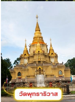
วัดพุทธาริวาส