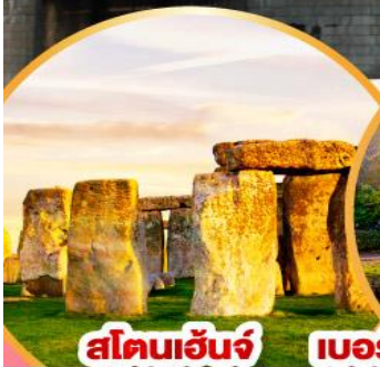
สโตนเฮนจ์