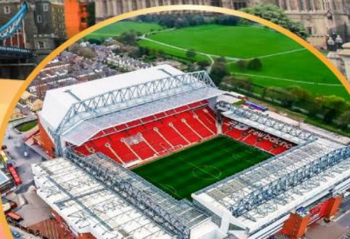
เข้าชมสนามฟุตบอลแอนฟิลด์

เมนูสุดพิเศษ!! Fish & Chips อาหารไทย และ ภัตตาคารดัง Four Season