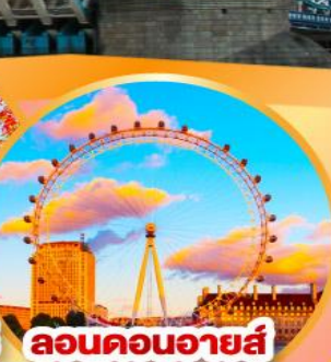
ลอนดอนอายส์