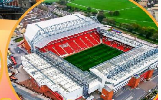
เข้าชมสนามฟุตบอลแอนฟิลด์

เมนูสุดพิเศษ!! Fish & Chips อาหารไทย และ ภัตตาคารดัง Four Season