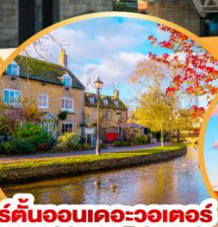
เบอร์ตันออนเคะวอเทอร์