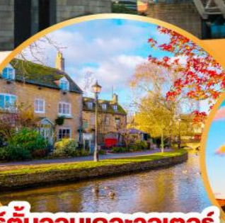
เบอร์ตันออนเดอะวอเตอร์