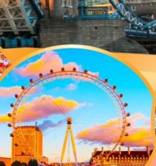
ลอนดอนอายส์