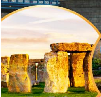
สโตนเฮนจ์