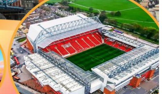
เข้าชมสนามฟุตบอลแอนฟิลด์

เมนูสุดพิเศษ!! Fish & Chips อาหารไทย และ ภัตตาคารดัง Four Season