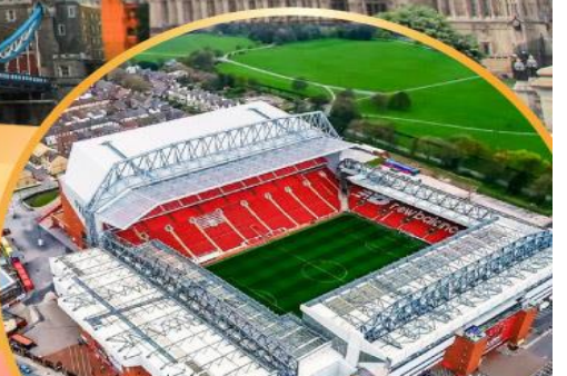
เข้าชมสนามฟุตบอลแอนฟิลด์

เมนูสุดพิเศษ!! Fish & Chips อาหารไทย และ ภัตตาคารดัง Four Season