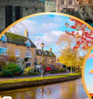
เบอร์ตันออนเดอะวอเตอร์