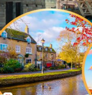
เบอร์ตันออนเคอะวอเตอร์