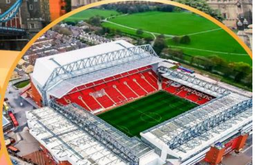
เข้าชมสนามฟุตบอลแอนฟิลด์

เมนูสุดพิเศษ!! Fish & Chips อาหารไทย และ กัดดาการดัง Four Season