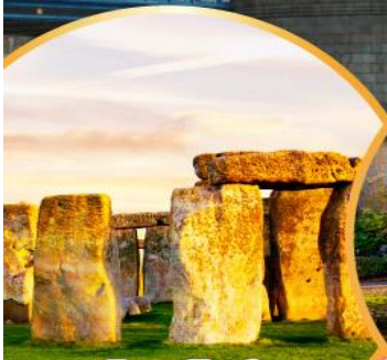
สโตนเฮนจ์