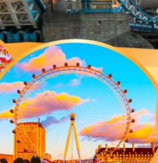
ลอนดอนอายส์