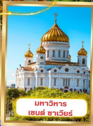
มหาวิหาร เซนต์ ซาเวียร์