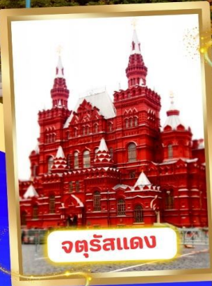
จตุรัสแดง