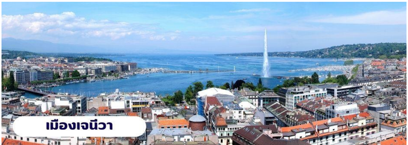
เมืองเจนีวา

🕒 บริการอาหารเช้า ณ ห้องอาหารของโรงแรม นำท่านเดินทางสู่ เมืองเจนีวา ใช้เวลาเดินทางประมาณ 4 ชั่วโมง เป็นเมืองขนาดใหญ่ที่มีความงดงาม และเป็นประตูสู่เทือกเขาแอลป์ มีนาฬิกาดอกไม้ริมทะเลสาบและน้ำพุเป็นสัญลักษณ์ของเมือง นอกจากนี้ยังเป็นเมืองคมนาคมหลักของทวีปยุโรปอีกด้วย