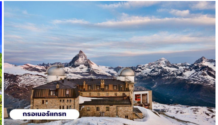
กรอนอร์โกรน

ถึงเวลาอันสมควรนำท่านเดินทางกลับสู่เมืองเซอร์แมทอีกครั้งโดยรถไฟ อิสระให้ท่านเดินเล่นชมเมืองเซอร์แมท เลือกซื้อสินค้าของฝากพื้นเมือง หรือนาฬิกาสวิสอันขึ้นชื่อตามอัธยาศัย สมควรแก่เวลานำท่านขึ้นรถไฟกลับสู่เมืองแทสซ์