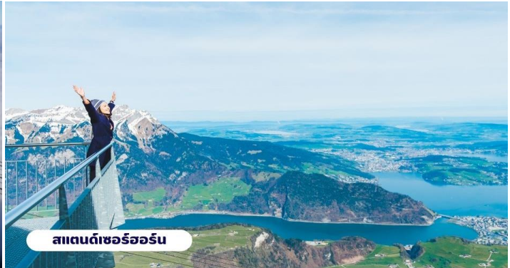
สแตนดาร์ดเซอร์วิส

เที่ยง ☉ บริการอาหารกลางวัน ณ ภัตตาคาร จากนั้นนำท่านเดินทางสู่ เมืองมิลาน (MILAN) ใช้เวลาเดินทางประมาณ 4 ชั่วโมง เมืองสำคัญในภาคเหนือของประเทศอิตาลี ตั้งอยู่ในแคว้นที่ราบลอมบาร์ดีเป็น เมืองที่มีชื่อเสียงในด้านแฟชั่นและศิลปะ ซึ่งมิลานถูกจัดให้เป็นเมืองแฟชั่นในลักษณะเดียวกับ นิวยอร์ก ปารีส ลอนดอน และ โรม