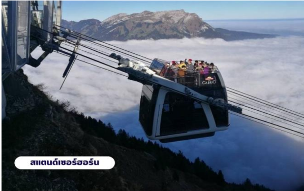
สแตนดาร์ดเซอร์วิส

เขาท่านจะสามารถมองเห็นวิวแบบ 360 องศา จากนั้นให้ท่านได้เพลิดเพลินกับความสวยงามของธรรมชาติและทัศนียภาพที่งดงาม