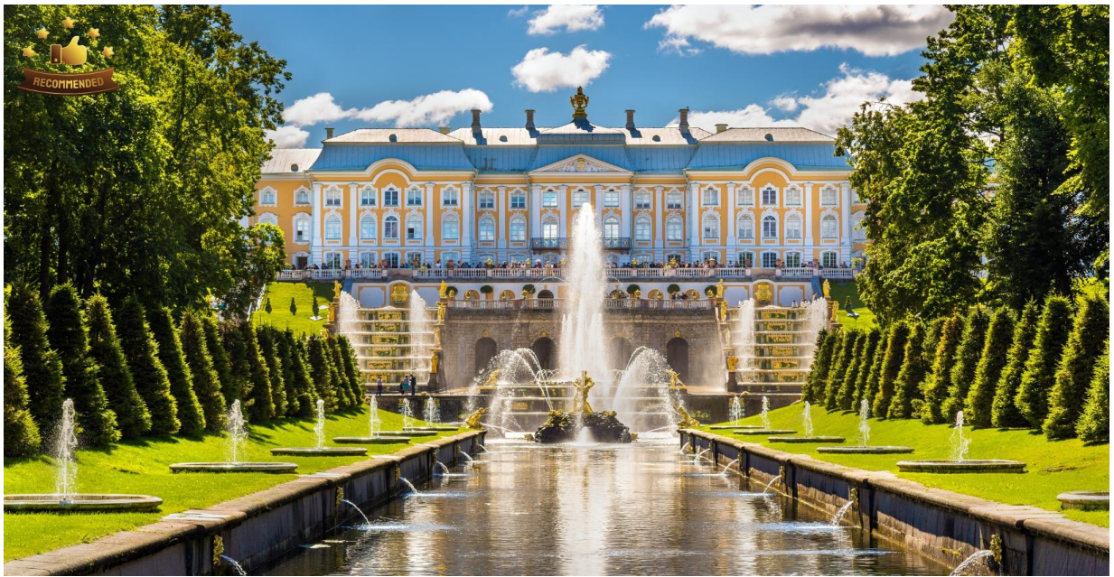
จากนั้นนำท่านชม พระราชวังปีเตอร์ฮอฟ (Peterhof Palace)

เช้า บริการอาหารเช้า ณ ห้องอาหารของโรงแรม