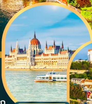
ส่องเรือแม่น้ำดานูบ