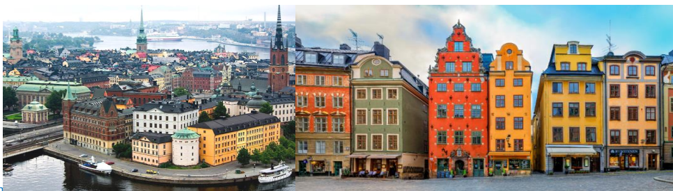
Summer Nice Scan