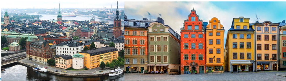
Summer Nice Scan

วันที่สอง (วันที่ 19 ก.ค.2567) อีสตันบูล (ตุรเกีย) - สต็อกโฮล์ม (สวีเดน) 05.15 น. เดินทางถึงสยามบิณสูวรรณภูมิ ประเทศตุรเกีย เพื่อแวะเปลี่ยนเครื่อง 07.35 น. ออกเดินทางสู่ สยามบิณสูวรรณภูมิ โดยสายการบิน Turkish Airlines เที่ยวบินที่ TK-1793 10.10 น. เดินทางถึง สยามบิณสูวรรณภูมิ กรุงสต็อกโฮล์ม ประเทศสวีเดน หลังนำท่านผ่านพิธีการตรวจคนเข้าเมือง และตรวจรับสัมภาระเรียบร้อยแล้ว นำท่านเดินทางสู่ใจกลาง กรุงสต็อกโฮล์ม Stockholm เมืองหลวงของ ประเทศสวีเดน ซึ่งอยู่บนหมู่เกาะใหญ่น้อยโอบล้อมด้วยทะเลสาบมาลาร์กอก่าเกิดนครอันงามสง่า ริมคลองมากมายจนได้รับฉายาว่า “ราชินีแห่งทะเลบอลติก” นำท่านชม แกมล่าสแตน Gamla Stan หรือเขตเมืองเก่า และ ชมศาลาว่าการเมืองสต็อกโฮล์ม City Hall สัญลักษณ์ของกรุงสต็อกโฮล์ม