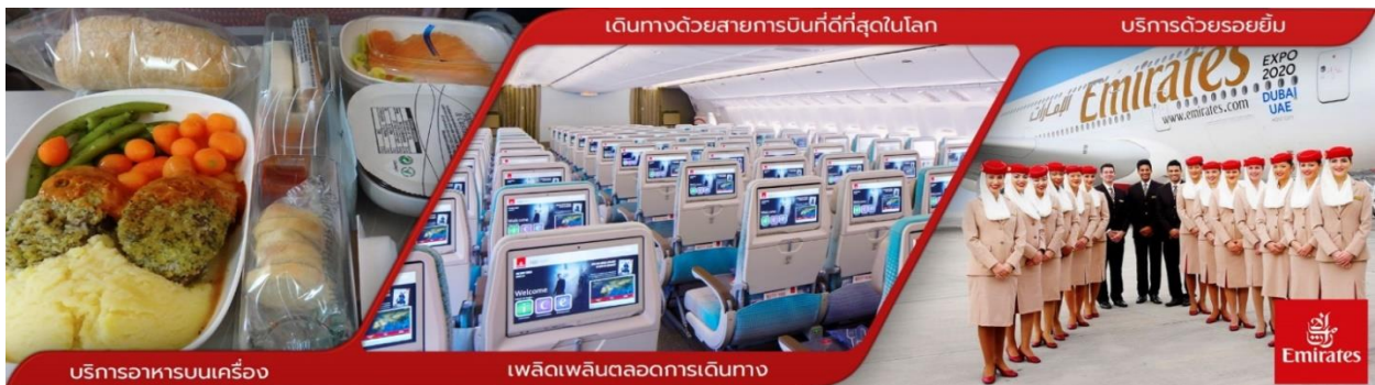
บริการอาหารบนเครื่อง

23.30 น. คณะพร้อมกันที่ สนามบินสุวรรณภูมิ ชั้น 4 บริเวณเคาน์เตอร์ T สายการบินเอมิเรตส์ EMIRATE AIRLINE (EK) โดยมีเจ้าหน้าที่ช่องทางบริษัทฯ คอยต้อนรับ และอำนวยความสะดวกด้านเอกสาร ออกบัตรที่นั่งและโหลดสัมภาระในการเดินทาง