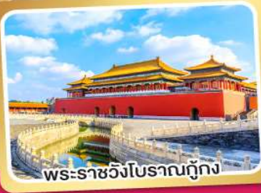
พระราชวังโบราณถู่ถู่