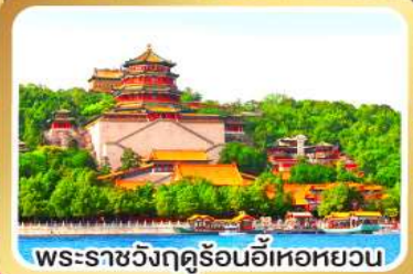
พระราชวังฤดูร้อนอี่เหอหยวน