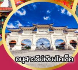
อนุสาวรีย์เจียงไคเช็ค