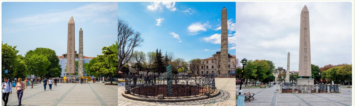
หน้า 13 (ภาพใช้เพื่อการโฆษณาเท่านั้น)

จากนั้นนำทุกท่านสู่ จัตุรัสสุลต่านอะห์เมตหรือฮิปโปโดรม (HIPPODROME) สนามแข่งม้าของชาวโรมัน จุดศูนย์กลางแห่งการท่องเที่ยวเมืองเก่า สร้างขึ้นในสมัยจักรพรรดิ เซปติมิอุสเซเวรุสเพื่อใช้เป็นเวทีแสดงกิจกรรมต่างๆของชาวเมือง ต่อมาในสมัยของจักรพรรดิคอนสแตนตินฮิปโปโดรมได้รับการขยายให้กว้างขึ้นตรงกลางเป็นที่ตั้งแสดงประติมากรรมต่างๆซึ่งส่วนใหญ่เป็นศิลปะในยุคกรีกโบราณในสมัยออตโตมันสถานที่แห่งนี้ใช้เป็นที่จัดงานพิธีแต่ในปัจจุบันเหลือเพียงพื้นที่ลานด้านหน้ามัสยิดสุลต่านอะห์เมตซึ่งเป็นที่ตั้งของเสาโอเบ