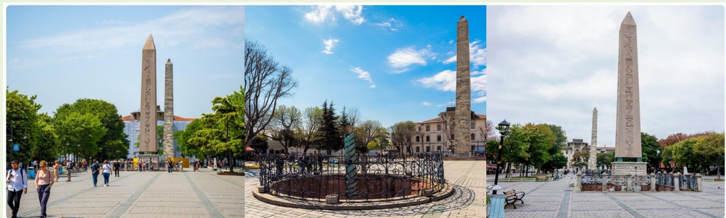
หน้า 13 (ภาพใช้เพื่อการโฆษณาเท่านั้น)

จากนั้นนำทุกท่านสู่ จัตุรัสสุลต่านอะห์เมตหรือฮิปโปโดรม (HIPPODROME) สนามแข่งม้าของชาวโรมัน จุดศูนย์กลางแห่งการท่องเที่ยวเมืองเก่า สร้างขึ้นในสมัยจักรพรรดิ เซปติมิอุสเซเวรุสเพื่อใช้เป็นเวทีแสดงกิจกรรมต่างๆของชาวเมือง ต่อมาในสมัยของจักรพรรดิคอนสแตนตินฮิปโปโดรมได้รับการขยายให้กว้างขึ้นตรงกลางเป็นที่ตั้งแสดงประติมากรรมต่างๆซึ่งส่วนใหญ่เป็นศิลปะในยุคกรีกโบราณในสมัยออตโตมันสถานที่แห่งนี้ใช้เป็นที่จัดงานพิธีแต่ในปัจจุบันเหลือเพียงพื้นที่ลานด้านหน้ามัสยิดสุลต่านอะห์เมตซึ่งเป็นที่ตั้งของเสาโอเบ