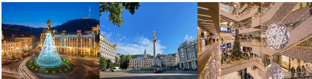
Georgia New Year 6D4N (TBS-TBS), ON 27 DEC-01 JAN AND 28 DEC- 02 JAN 2024

นำท่านชม โบสถ์ทรินิตี้ Holy Trinity Cathedral วิหารศักดิ์สิทธิ์ของทบิลีซี ที่เรียกกันว่า Sameba เป็นโบสถ์หลักของคริสตจักรออร์ทอดอกซ์จอร์เจียตั้งอยู่ในทบิลีซีเมืองหลวงของจอร์เจีย สร้างขึ้นระหว่างปี 1995 ถึง ปี 2004 และเป็นวิหารที่สูงที่สุด อันดับที่ 3 ของโบสถ์ออร์ทอดอกซ์ในโลก นำท่านเดินเล่นชมเมืองทบิลีซีย่าน ฟรีดอมสแควร์ Freedom Square จตุรัสใจกลางเมืองที่ถูกสร้างขึ้นสมัยถูกปกครองโดยสหภาพโซเวียต เป็นศูนย์กลางของเส้นทางการคมนาคมของกรุงทบิลีซีและยังเป็นที่ตั้งของอาคารรัฐสภาและหน่วยงานของรัฐ ให้ท่านได้ชมบรรยากาศของอาคารบ้านเรือนอันคลาสสิกสุดอลังการในสถาปัตยกรรมยุโรปแบบนีโอโคโลเนียลอันสุดคลาสสิก หรือช้อปปิ้งที่ห้าง Galleria Mall ศูนย์การค้าใจกลางกรุงทบิลีซีที่เต็มไปด้วยร้านค้า ร้านอาหาร คาเฟ่ และสินค้าแบรนด์เนมหลากหลายแบรนด์ **เพื่อความสะดวกในการเดินเล่นชมเมืองและเลือกซื้อสินค้าอิสระรับประทานอาหารค่ำตามอัธยาศัย**