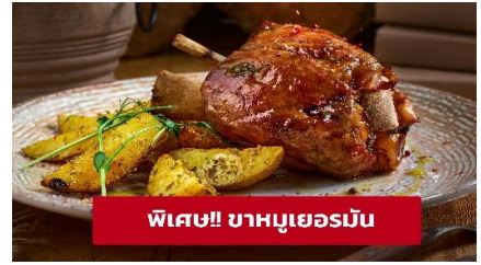
พิเศษ! ขาหมูเยอรมัน

๑๐ รับประทานอาหารกลางวัน (มื้อที่6) เมนูพิเศษ! ขาหมูเยอรมัน นำท่านเที่ยวชม เมืองฟูสเซน (Fussen) ขึ้นชื่อเรื่องความสวยงามของตัวตึกรามบ้านช่องเพราะทั้งเมืองจะมีหลากสีสันเหมือนกับลูกกวาดสีสวยๆ ทั้งเมืองจนได้รับสมญานามว่า City of candy นำท่านเดินทางสู่ เมืองเคมป์เทิน (Kempten) (ระยะทาง 46 กม./ 1 ชั่วโมง) เป็นชุมชนเมืองที่เก่าแก่ที่สุดในเยอรมนี ให้ท่านถ่ายรูปบริเวณด้านนอก มหาวิหารเซนต์ลอว์เรนซ์ แอชวิลล์ (Basilica of Saint Lawrence) สร้างเสร็จในปี 1909 และเป็นหนึ่งในสมบัติทางสถาปัตยกรรมและจุดยึดทางจิตวิญญาณของแอชวิลล์