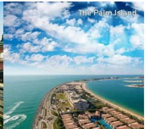
The Palm Island