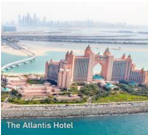
The Atlantis Hotel

นำท่าน นั่งรถไฟ MONORAIL > เดินทางสู่โครงการเดอะปาล์ม THE PALM ซึ่งเป็นโครงการที่อสังการ สุดยอดโปรเจกต์โดยการถมทะเล ให้เป็นเกาะเทียมสร้างเป็นรูปต้นปาล์ม 3 เกาะ บนเกาะมีที่พักโรงแรม รีสอร์ท อพาร์ทเมนท์ ร้านค้า ภัตตาคาร รวมทั้งสำนักงาน ต่าง ๆ นับว่าเป็นสิ่งมหัศจรรย์อันดับ 8 ของโลก