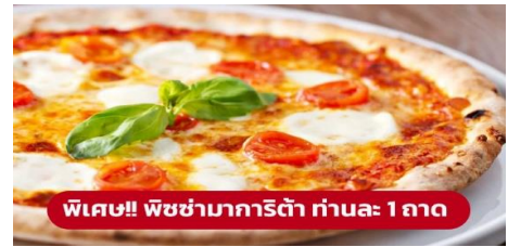
พิเศษ!! พิซซ่ามาการิตต้า ท่านละ 1 ถาด

นำท่านเดินทางสู่ เมืองเวนิสเมสเตร (Venice Mestre) (ระยะทาง 322 กม. / 5 ชม.) หนึ่งในเมืองเวนิส เป็นย่านเมืองเก่าแก่ ที่มีความสวยงามและน่าสนใจเป็นอย่างมาก ที่จะแสดงให้เห็นถึงความ เป็น อิตาเลียนขนานแท้