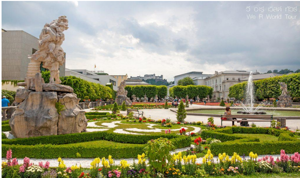
กัสโต เวิลด์ ทัวร์ We R World Tour

สร้างขึ้นตั้งแต่ปี ค.ศ. 774 ถือเป็นโบสถ์บาโรกยุคแรก ถูกสร้างขึ้นใหม่แทนโบสถ์หลังเดิมที่ถูกไฟไหม้ จนเกินซ่อมแซม มหาวิหารแห่งนี้ถูกบูรณะใหม่อีกครั้งหลังจากถูกระเบิดในสมัยสงครามโลกครั้งที่ 2 นำท่านชม สวนมิราเบลล์ (MIRABELL GARDEN) สวนสาธารณะสไตล์บาโรกที่สวยงามที่สุดในเมือง เดิมเป็นสวนของพระราชวังมิราเบลล์ (MIRABELL PALACE) ซึ่งพระราชวังแห่งนี้ก็เป็นหนึ่งในสถานที่ที่โมซาร์ทเคยมาจัดการแสดง และยังเป็นสถานที่ถ่ายทำภาพยนตร์เรื่อง The Sound of Music อีกด้วย นำท่านแวะถ่ายภาพเป็นที่ระลึก ณ บ้านเกิดโมซาร์ท (MOZART'S BIRTHPLACE) อาคารสี่เหลี่ยม หมายเลข 9 ซึ่งเป็นสถานที่เกิดและเติบโตของคีตกวีเอกของโลกวัยรวม 20 ปี จากนั้นนำท่านถ่ายรูปกับ ป้อมปราการโฮเฮนซาลซ์บวร์ค (HOHENSALZBURG) เป็นปราสาทแห่งยุคกลางอายุกว่า 500 ปีที่ใหญ่และสภาพสมบูรณ์ที่สุดในยุโรป