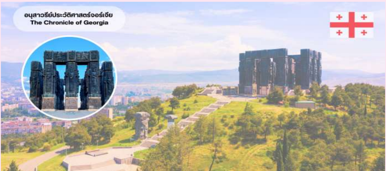
อนุสาวรีย์ประวัติศาสตร์จอร์เจีย The Chronicle of Georgia

ชมความอลังการเสายักษ์ และย้อนรอยประวัติศาสตร์จอร์เจีย “อนุสรณ์ประวัติศาสตร์จอร์เจีย” ได้ชื่อว่าเป็น “ Stonehenge of Georgia “