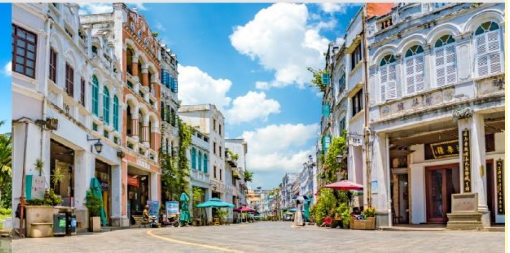
ถนนโบราณอีไหลว

*ทางบริษัทฯ ขอสงวนสิทธิ์ในการสลับโปรแกรมทัวร์ตามความเหมาะสมขึ้นอยู่กับสถานการณ์หน้างาน โดยคำนึงถึงผลประโยชน์ของลูกค้าเป็นสำคัญ