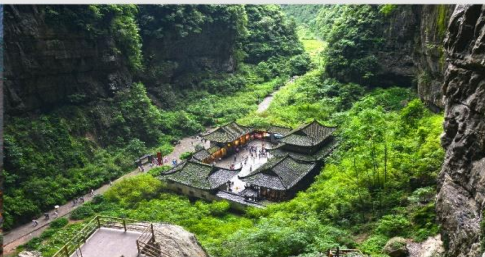
หลุมบ่อฟ้า