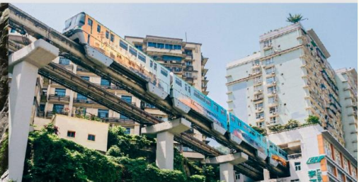
รถไฟฟ้าทะลุตึก

*ทางบริษัทฯ ขอสงวนสิทธิ์ในการสลับโปรแกรมทัวร์ตามความเหมาะสมขึ้นอยู่กับสถานการณ์หน้างาน โดยคำนึงถึงผลประโยชน์ของลูกค้าเป็นสำคัญ