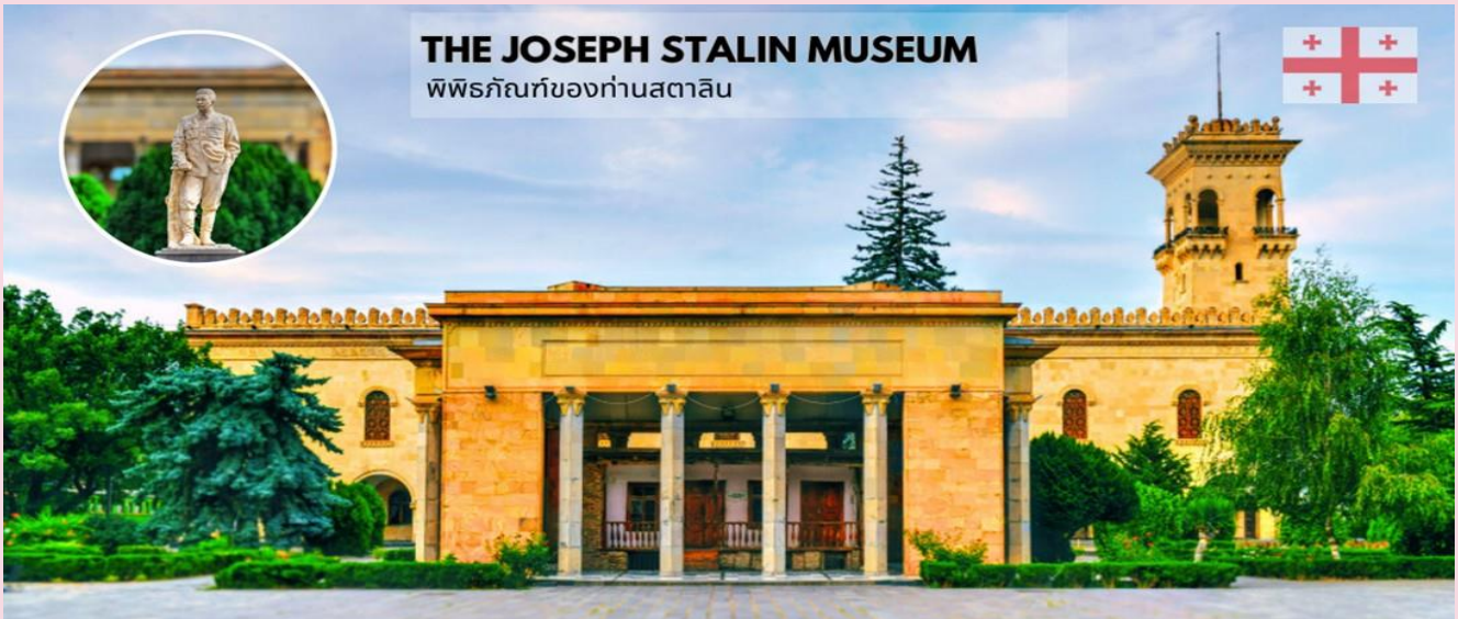
THE JOSEPH STALIN MUSEUM พิพิธภัณฑ์ของท่านสตาลิน

จากนั้นนำท่านเยี่ยมชม พิพิธภัณฑ์ของท่านสตาลิน (The Joseph Stalin Museum) ผู้นำคนสำคัญของสหภาพโซเวียต ซึ่งเป็นสถานที่รวบรวมเรื่องราวในวัยเด็ก และข้าวของเครื่องใช้ของท่านสตาลินเอาไว้ ของที่หาชมได้แค่ที่นี่คือ เครื่องราชอิสริยาภรณ์แห่งเลนินของสตาลิน (Order of Lenin), death mask ของสตาลิน รวมไปถึงบ้านหลังจริงที่ท่านสตาลินเกิดและอาศัยในวัยเด็ก และที่นี่ยังมีการจัดโชว์ “โบกี้รถไฟ” หรือตู้รถไฟที่ท่านสตาลินใช้ในการเดินทางในสมัยที่ยังดำรงตำแหน่งผู้นำ ซึ่งตู้รถไฟนี้มีความพิเศษคือถูกทำขึ้นมาโดยเฉพาะ ภายนอกบุหุ้มด้วยเกราะกันกระสุนนั้น ทำให้ตู้รถไฟนี้มีน้ำหนักมากถึง 80 ตันเลยทีเดียว