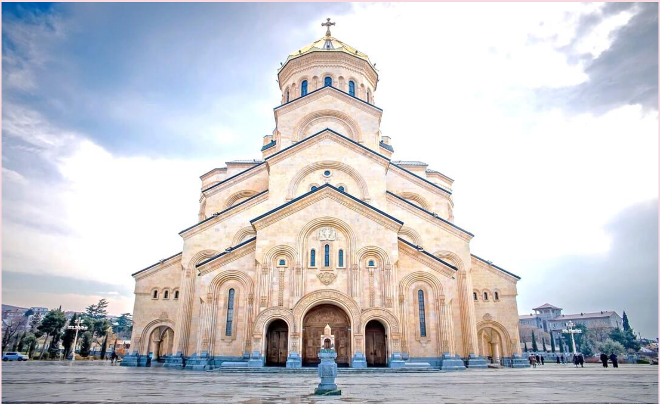
VGE64G9-1_ GEORGIA อลังการ จอร์เจีย ตะลุยสุดขอบเอเชีย 6 วัน 4 คืน (OCT - DEC)

นำท่านชม โบสถ์ทรินิตี้แห่งเมืองทบิลีซี หรือ วิหารศักดิ์สิทธิ์ของเมืองทบิลีซี เป็นโบสถ์หลักของคริสตจักรออร์ทอดอกซ์จอร์เจีย ตั้งอยู่ในทบิลีซีเมืองหลวงของจอร์เจีย สร้างขึ้นในระหว่างปี 1995 ถึง 1997 โบสถ์แห่งนี้ถือเป็นโบสถ์หลักในจอร์เจียที่มีความสูงอันดับ 3 ของโลก ด้านในโบสถ์ ผู้หญิงทุกคนจะต้องใช้ผ้าคลุมศีรษะตามหลักศาสนา โดยสืบเนื่องมาจากอิทธิพลของพระเยซูคริสต์ และปฏิบัติตามหลักการทางเทววิทยาอย่างไม่มี การเปลี่ยนแปลงมาตั้งแต่สมัยศาสนาคริสต์ยุคแรก