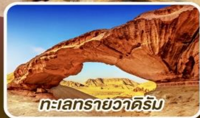
ทะเลทรายวาดีรัม