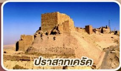
ปราสาทเคิร์ก