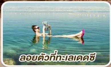
ลอยตัวที่ทะเลเดดซี